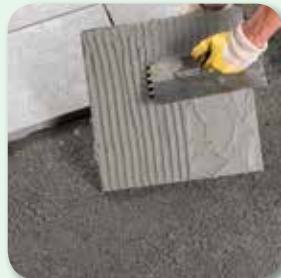
oder mit dem Zahnspachtel auftragen.