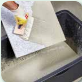
... quasten ...