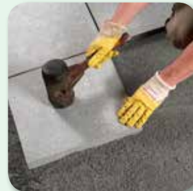
Verlegung „frisch in frisch“