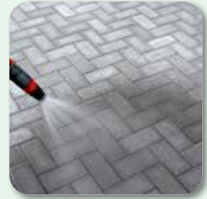
Fläche ausreichend wässern. Nachbehandlung beachten!