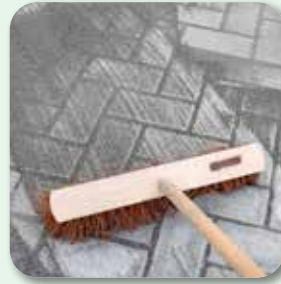
Anschließend nachsanden und erneut abrütteln. Danach rückstandsfrei abfegen und ggf. Fasen freilegen