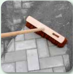
vdw VarioSand einfegen und von der Oberfläche abfegen